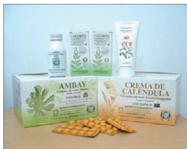
FIGURA 1: Fitomedicamentos aprobados en Argentina para uso en la Atención Primaria de Salud.