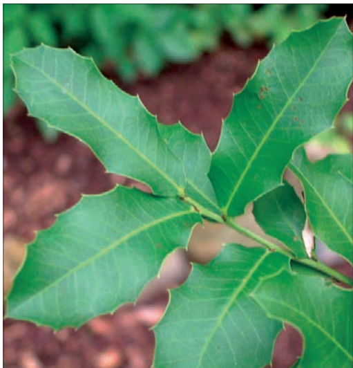
FIGURA 3. Congorosa ( Maytenus ilicifolia ).

han proporcionado resultados muy alentadores en artritis y artrosis. Los curcuminoides han mostrado actuar regulando numerosos factores de transcripción, citoquinas, proteinquinas, junto a una marcada actividad antioxidante (6) .