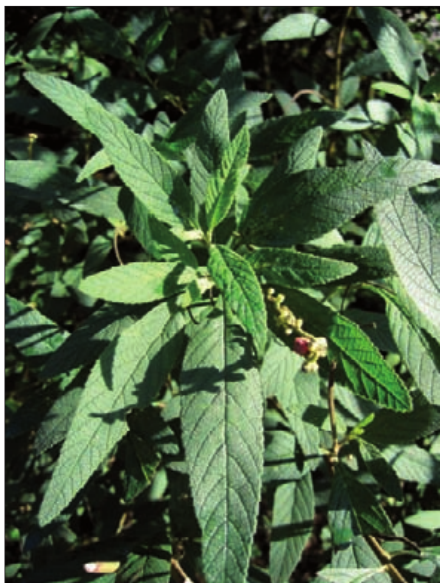
FIGURA 1. Cordia verbenacea .

Emerson F. Queiroz Renato do Rego de Araujo Faro Carlos Alberto Melo