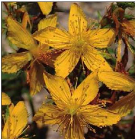
FIGURA 1. Hypericum perforatum .