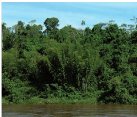
FIGURA 1. Parque Nacional de Iguazú (Brasil).