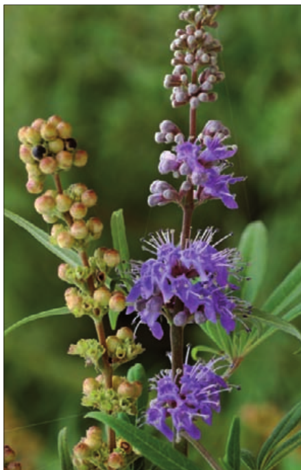
FIGURA 1: Vitex agnus-castus .