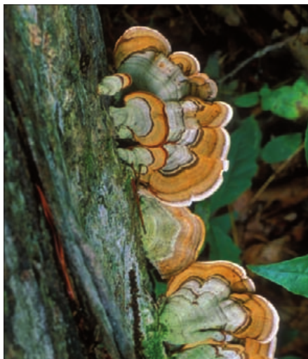
FIGURA 1. Coriolus versicolor .