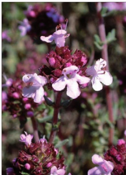
FIGURA 1. Thymus vulgaris .