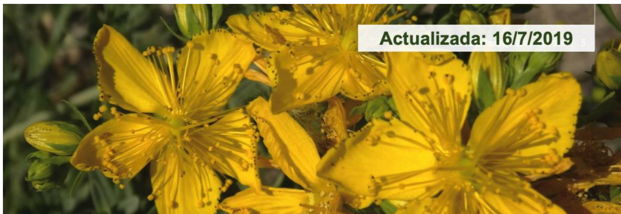
Tabla de interacciones entre preparados vegetales y fármacos de síntesis