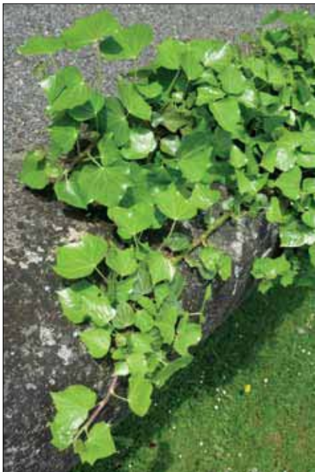
FIGURA 1. Hiedra.