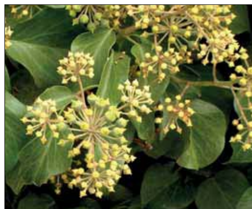
FIGURA 2. Inflorescencias de hiedra.

Los extractos de hoja de hiedra y sus componentes han mostrado en diferentes modelos experimentales actividad secretolítica (mucolítica), espasmolítica, antiinflamatoria,