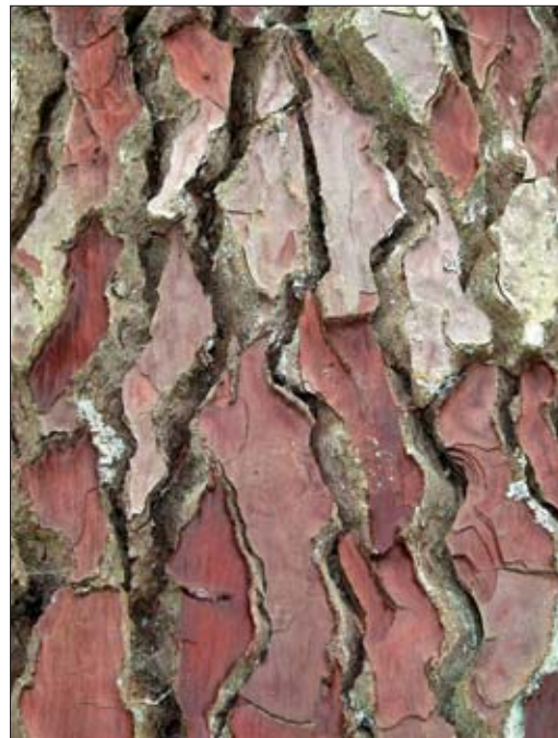
FIGURA 4. Corteza de Pinus pinaster Aiton.

La actuación del PG sobre la sintomatología climatérica ha sido objeto de un único ensayo aleatorizado, doble ciego, frente a placebo, en el que tomaron parte 200 mujeres en etapa perimenopáusica. Según los resultados obtenidos, el grupo tratado con PG (200 mg/día) experimentó mejoría en todos los síntomas incluidos en el WHQ (Women's Health Questionnaire) en comparación con el grupo placebo, al igual que en sus defensas antioxidantes y en la relación LDL/HDL (73) , no observándose efectos secundarios en ningún caso.