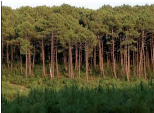
FIGURA 1. Plantación de pino marítimo en las Landas de Gascuña (Francia).