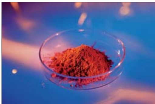
FIGURA 3. Pycnogenol®. Foto cortesía de www.pycnogenol.com .

fin de nombrar a una determinada clase compuestos derivados de flavan-3-oles.