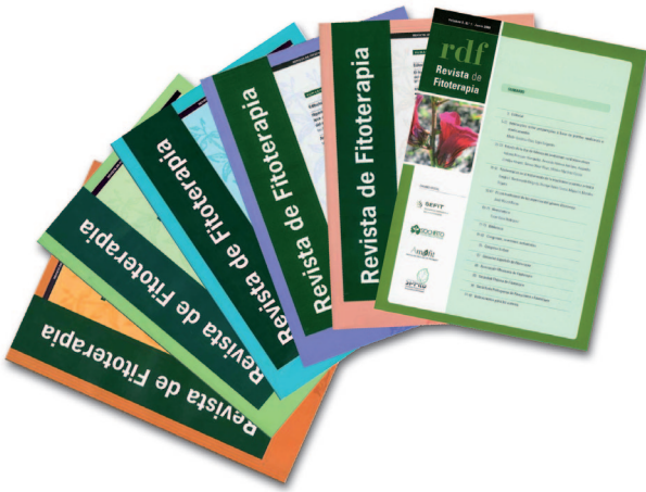
FIGURA 1. Portadas de la Revista de Fitoterapia.