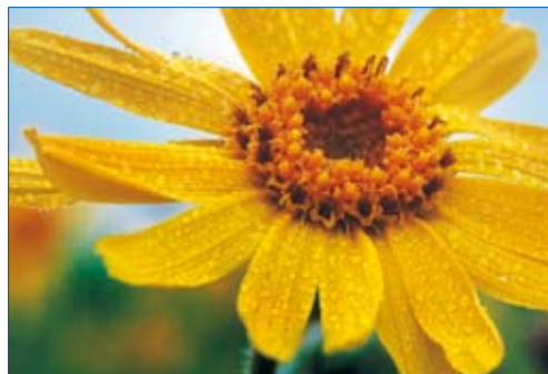
FIGURA 1. Arnica montana .