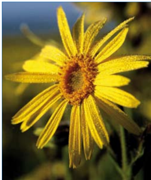
FIGURA 4. Arnica montana .

Mientras que la administración de medicamentos por vía tópica dispone de una larga tradición en dermatología, en las últimas décadas se ha establecido en cardiología (parches de nitrato) y gradualmente se está convirtiendo en habitual en reumatología. En este sentido, la realización de pruebas pertinentes, mediante estudios metodológicamente estrictos supone el único procedimiento válido para determinar qué agentes ofrecen un beneficio real. En nuestro estudio descubrimos que el árnica es, en esencia, semejante al ibuprofeno cuando se utiliza por vía tópica.