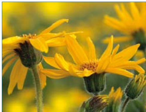
FIGURA 2. Arnica montana .

Se estableció que, para que se cumpliera el criterio de no inferioridad del gel de árnica frente al de ibuprofeno, la diferencia en los dos parámetros primarios de eficacia no debía ser mayor del 12%, que corresponde a 3,6 puntos en la escala algorfuncional de la mano (HAI) y de 12 mm en la escala visual VAS para el dolor, por lo tanto a una diferencia estandarizada (tamaño de efecto) de 0,66. Se obtuvo una desviación estándar de 5,5 para la validación de los datos de la escala HAI (25) . El parámetro estadístico Mann-Whitney P(X < Y) fue utilizado como medida