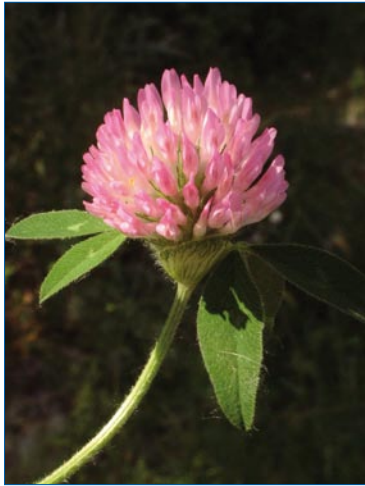
FIGURA 1. Trifolium pratense .