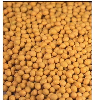
FIGURA 3. Glycine max . Foto: Martin Wall.