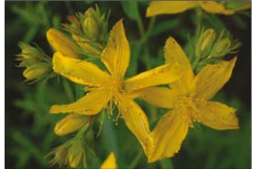
FIGURA 1. Hypericum perforatum .