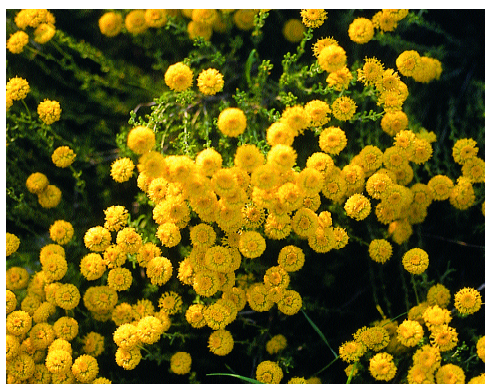
Santolina chamaecyparissus .