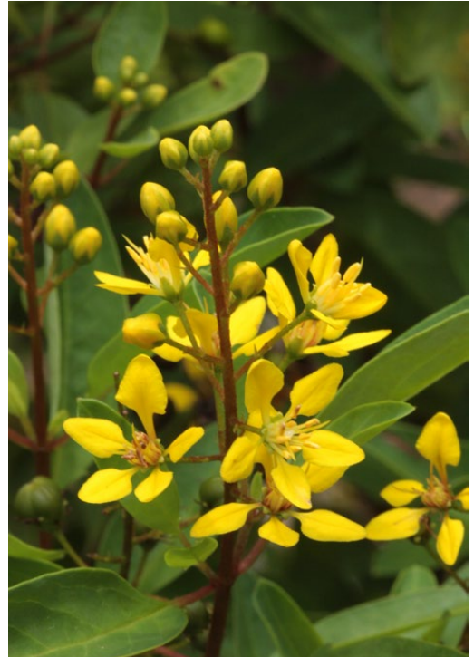
FIGURA 4. Galphimia glauca .

Se ensayó la toxicidad de tres extractos de G. glauca (acuoso, etanólico y metanólico), estandarizados según el contenido de tres galfiminas, pero que con toda probabilidad también contenían todos los constituyentes responsables de la actividad antiasmática, y se evaluaron sus efectos conductuales y fármaco-toxicológicos. Después de administrar el extracto a ratones durante 28 días (2,5g/Kg, p.o.), no se observó ninguna muerte y el análisis histopatológico de los distintos órganos no mostraba alteraciones; solo los parámetros de comportamiento analizados mostraron una disminución de la actividad espontánea. La administración de estos extractos durante 56 días (a la misma dosis y vía de administración) en ratones no causó ningún cambio en los parámetros bioquímicos que evalúan la función hepática. En cuanto a los efectos citotóxicos, no se observaron en líneas celulares transformadas KB, UISO y OVCAR-5; pero todos los extractos inhibieron específicamente el crecimiento de una línea celular de cáncer de colon con una ED 50 inferior a 2 µg /mL. También se efectuó el test de genotoxicidad in vitro (250, 100 y 50 µg/mL), sin que ninguno de los tres extractos se mostrara activo (7) . Nakanishi et al. incluyeron esta planta en su cribado farmacológico para