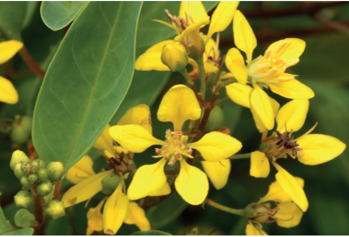
FIGURA 1. Hoja e inflorescencia de Galphimia glauca .