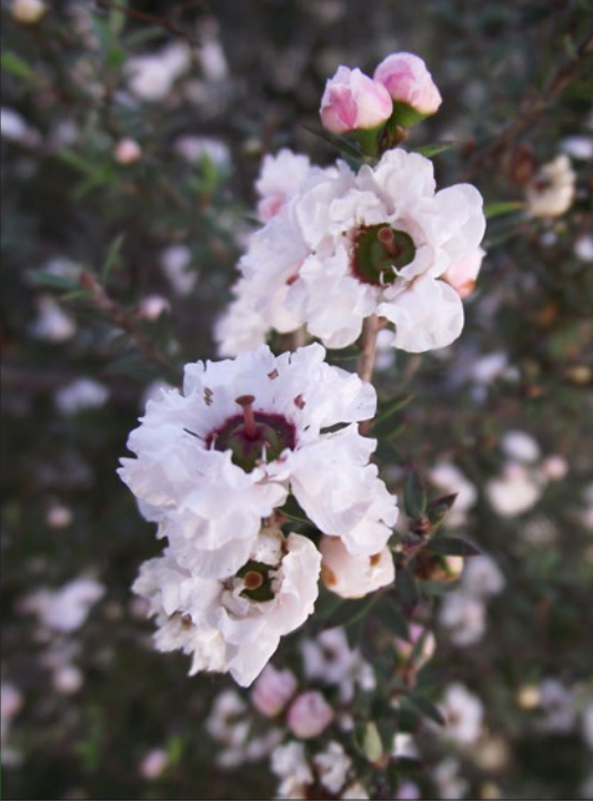
FIGURA 1. Leptospermum scoparium "Snow White".