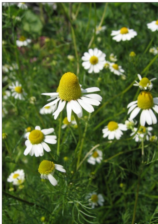
FIGURA 5. Flor de Matricaria recutita .

contribuir para o aumento dos níveis de colagénio (53) e demonstra também possuir propriedades antifúngicas contra a Candida albicans (52) .