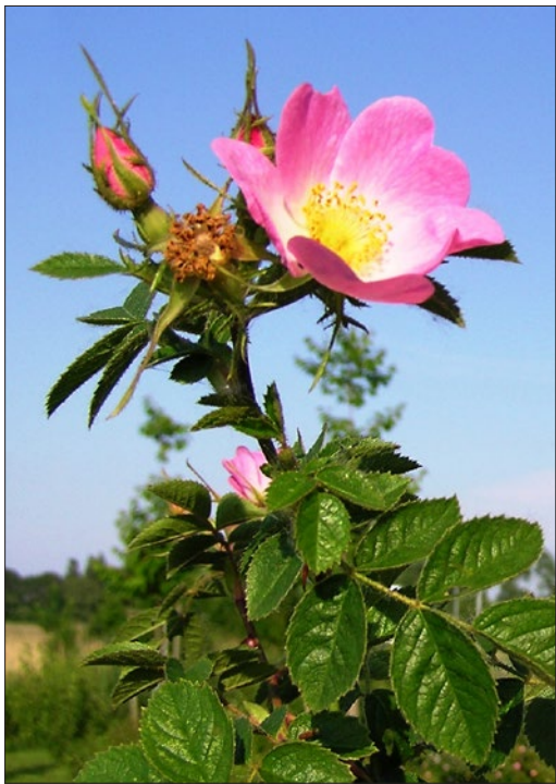
FIGURA 2. Rosa rubiginosa .

em climas temperados e continentais moderados. Esta planta foi também introduzida no continente americano (sul e centro do Chile, Argentina, Peru e Estados Unidos) (6)