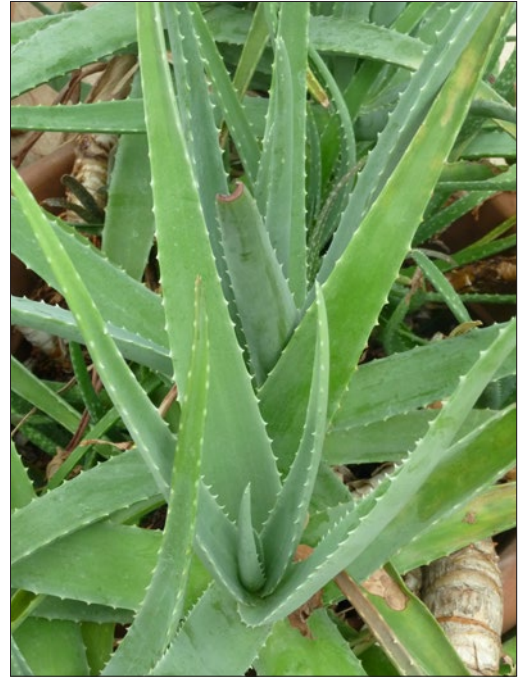
FIGURA 4. Aloe vera .

A planta possui um elevado teor em água (99-99,5%) e os restantes 0,5-1% são minerais, vitaminas, ácidos orgânicos, enzimas, compostos fenólicos (35) e principalmente polissacáridos (pectinas, celulose, hemicelulose e um galactoglucomanano acetilado - acemanano). A composição química da planta depende da distribuição geográfica, da qualidade do solo, disponibilidade de água, radiação solar e temperatura (36) . O Aloe vera é efetivo em inibir reações inflamatórias pela inibição da interleucina 6 (IL-6) e interleucina 8 (IL-8), redução da adesão de leucócitos, aumento dos níveis de interleucina 10 (IL-10) e diminuição dos níveis de TNF- \alpha (34) .