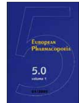
FIGURA 3. Farmacopea Europea (5ª edición).