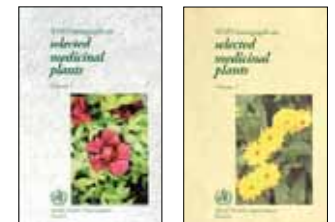
FIGURA 5. Monografías de la OMS sobre plantas medicinales.