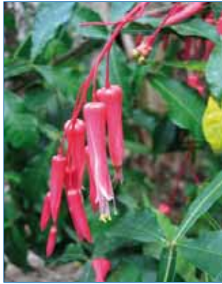
FIGURA 1. Quassia amara (cuasia o hombre grande).