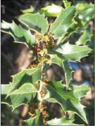
FIGURA 6. Maytenus ilicifolia (congorosa).