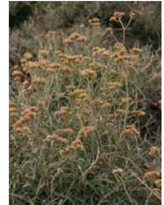
FIGURA 2. Achyrocline satureioides (marcerla).